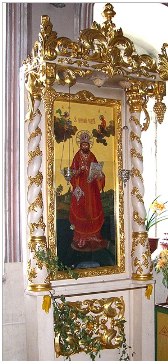
Икона свт. Николая Чудотворца со св. мощами

храма Орловско-Ливенской епархии в 1995 году отец Иоанн Крестьянкин внёс значительные пожертвования на восстановление Свято-Ильинского (Николо-Песковского) храма. Его стараниями были пожертвованы священнические облачения, богослужebные книги и многое другое.