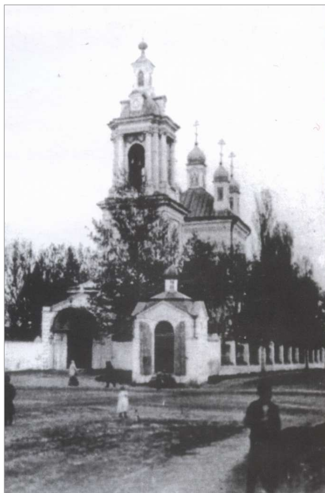
Фотография начала XX века